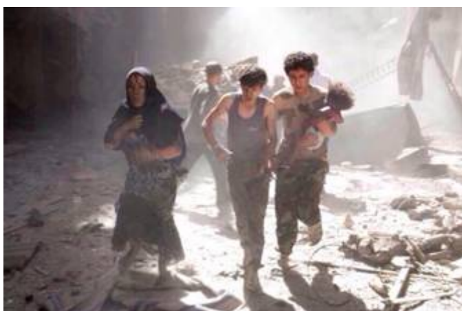
Syrisch gezin op de vlucht in Aleppo, Syrië, geplakt op Gaza.

demoniseren en aan de schandpaal te nagelen.