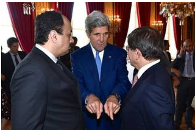
John Kerry hier in gesprek met twee van Israëls grootste vijanden, met de ministers van BuZo van Qatar en Turkije ter bespreking van een Hamas-vriendelijk staakt-het-vuren.

Maar wat Kerry uiteindelijk voorstelde was iets totaal anders en kwam hij met een document wat in overleg met Hamas' vrienden Qatar en Turkije tot stand is gekomen . Noch Israël, noch Egypte, noch het bewind van Abu Mazen (Mahmoud Abbas) waren vertegenwoordigd in die gesprekken. Alleen Israëls felste tegenstanders mochten aanschuiven. Tot verbijstering van velen in Israël kwamen de voorwaarden in dit document overeen met de eisen van de in Qatar zetelende Hamas opperschurk en miljardair Khaled Meshaal . Kerry presenteerde die vervolgens 'als een Amerikaans (wapenstilstand) voorstel,' aldus een Israëlische regeringsfunctionaris in de krant Yisrael Hayom . In zijn plan is geen enkele rekening gehouden met Israëls veiligheidsbelangen. Het gaat om een voor Israël totaal verwerpelijk document waarin de terreur van Hamas opnieuw wordt beloond. Obama eiste van Israël onmiddellijk te stoppen met aanvallen op Hamas en noemde de eis van Israël Hamas te ontwapenen een 'zorg voor latere tijd'. Ook zei hij Turkije en Qatar te vertrouwen en dat het niet aan Israël is de onderhandelaars te kiezen. Dat Washington zich zo duidelijk achter Hamas zou opstellen had niemand in Jeruzalem verwacht. Het Israëlische veiligheidskabinet kon Kerry's plannen aanvankelijk dan ook niet geloven, en dacht dat er sprake was van een misverstand. Maar dat was het niet!