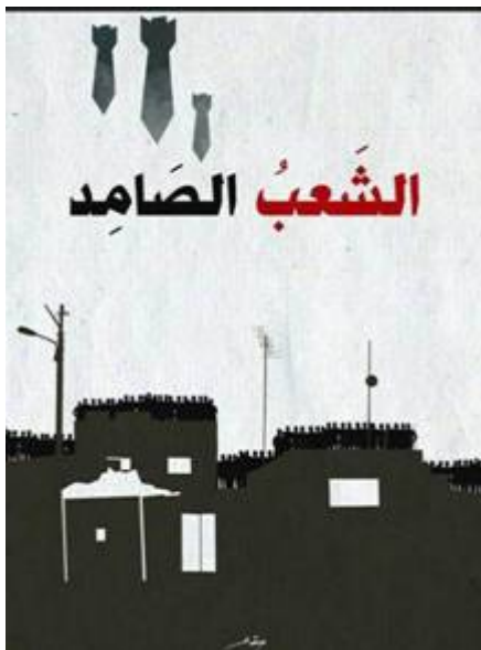
Pamflet met oproep om als menselijk schild dienst te doen.