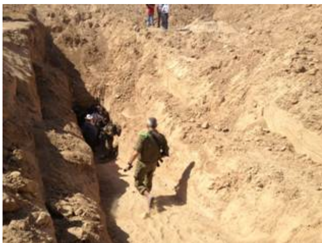
Hamas terreurtunnel nabij Kibbutz Sufa

Israëlische kant waren geen gewonden. Rond de tunnelopening lag het vol met achtergelaten schiettuig en in de tunnel zelf werden onder meer RPG raketten, explosieven, boobytraps, radio's en mini bunkers aangetroffen. Het leger verwachtte al een infiltratiepoging via één van de vele ontdekte tunnels. De betrokken tunnel werd weggebombardeerd evenals 34 nadien ontdekte tunnels . Deze tunnels lopen honderden meters diep Israël in en vormen een directe bedreiging voor de omliggende Israëlische dorpen.