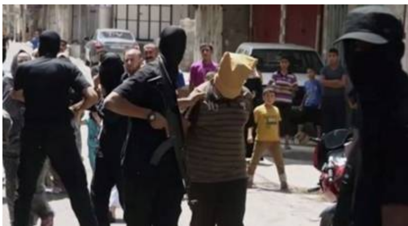
Gaza, vrijdag 22 augustus 2014. Gemaskerde Qassam beulen pakken willekeurig Palestijnen op die de moskee uitkwamen en executeerden verscheidene van hen ter plekke op verdenking van collaboratie met Israël.

En net als in de voorgaande oorlogen was het in Gaza weer bijtjesdag. Er worden steeds meer gruwelijke details bekend over de moordpartijen van Hamas op de burgerbevolking in Gaza. Net als in de oorlog 2008/2009 werden ook nu weer willekeurig burgers opgepakt en na een korte ondervraging geëxecuteerd . Zes volslagen onschuldige burgers werden gewoon weggegrist uit de honderden die na het vrijdaggebed een moskee verlieten en vervolgens vermoord op beschuldiging van collaboratie voor Israël zonder dat daar enig bewijs voor geleverd werd. Dergelijke executies zijn zonder enig juridisch proces een schending van het internationaal humanitair recht. Deze video laat zien hoe 18 vermeende collaborateurs zijn gedood.