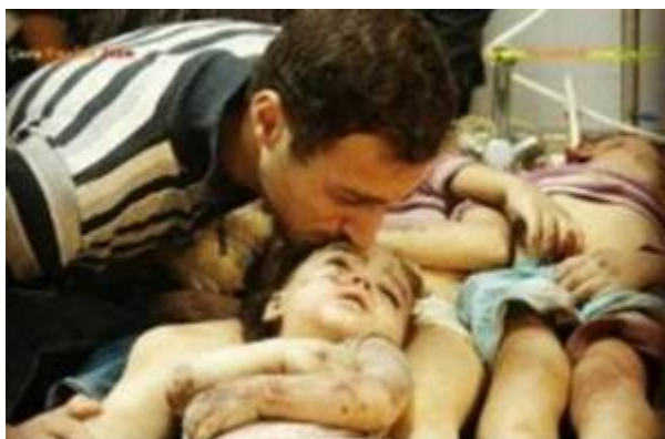
Deze foto is genomen tijdens de burgeroorlog in Syrië en door Hamas in Gaza gerecycled voor propagandadoeleinden.

Op de volgende video overtreffen de makers van Pallywood zichzelf. Een rij 'doden' die bedekt met witte doeken op de grond liggen, komen opeens tot leven. Op de doeken staan Arabisch-talige opschriften, hun namen wellicht. Kijk even goed want in Pallywood is het altijd anders dan het lijkt! Klik hier voor de video.