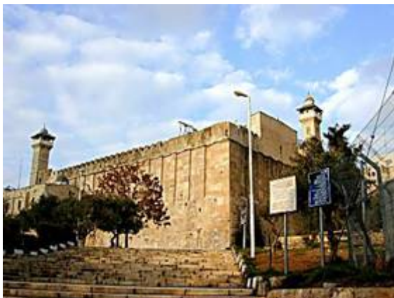
Het graf van de aartsvaders in Hebron

Het bureau van premier Benjamin Netanyahu noemde de beslissing van de UNESCO “belachelijk”. Het graf van Rachel en het graf in Hebron zijn al duizenden jaren een bedevaartsoord voor de Joden. Sommige onderzoekers stellen dat de Grot van Machpela voor de Joden als heilige plaats Bijbelhistorisch belangrijker is dan Jeruzalem. De poging om het volk Israël los te maken van zijn erfgoed is absurd.