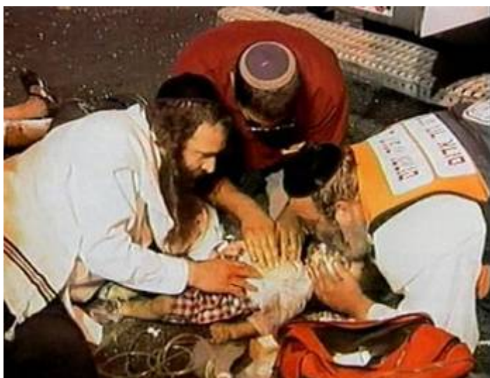
PLO-cultuur. Kleine kinderen slachtoffer van zelfmoordaanslag op Egged bus no2

Het gaat om een bewind dat zelfmoordenaars eert als moedige dappere mannen en vrouwen. Het gaat om terroristen die lachend vertellen over hun 'heldendaden' hoe ze onschuldige Israëlische burgers hebben vermoord met spijkerbommen en hele gezinnen de keel hebben doorgesneden. De beslissing van de UNESCO zegt natuurlijk ook veel over de landen die vóór het lidmaatschap van de nepstaat 'Palestina' hebben gestemd!