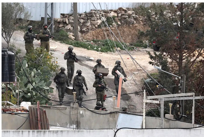
Israëlische soldaten naderen het Palestijnse dorp Kafr Dan in Jenin.

Zo hebben gewapende PLO-terroristen op de ochtend van 26 januari 2023 in Jenin een hevig vuurgevecht geleverd met Israëlische soldaten, waarbij ten minste negen doden zijn gevallen. Onder de Israëlische soldaten waren geen verliezen te betreuren. De soldaten waren naar de terreurstad Jenin gestuurd om een commandant van de plaatselijke afdeling van de Islamitische Jihad te arresteren, nadat de Israëlische inlichtingendienst informatie had ontvangen die wees op een Palestijnse Islamitische Jihad-cel in het gebied die van plan was onmiddellijk een grote aanval uit te voeren.