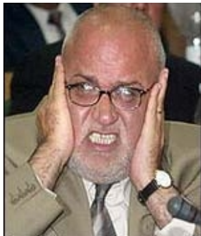
Palestinian Chief Negotiator Saeb Erekat can't believe his ears.

In april 2002 ging een golf van verontwaardiging door de wereld nadat de PLO-nazipropagandamachine het gerucht had verspreid dat het Israëlische leger tijdens " Operation Defensive Shield " een massaslachting had aangericht in Jenin. PLO-woordvoerders waaronder Saeb Erekat en Jasser Abed Rabbo vertelden dat er 1500 doden lagen onder het puin van het zogenaamde vluchtelingenkamp in Jenin.