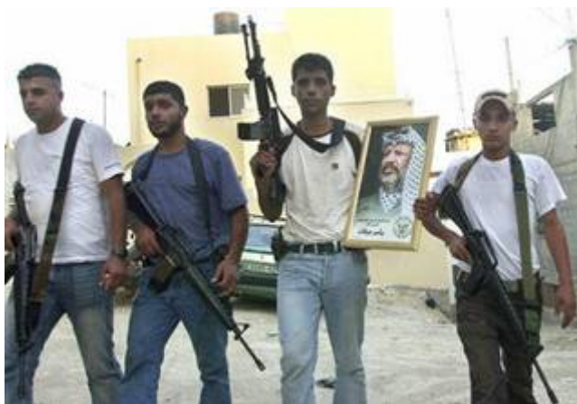
Zakaria Zubeidi, met portret van Arafat, een van de terreurleiders in Jenin.