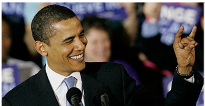
Barack Hoessein Obama

De Goddelijke Bijbelse leer dient volledig te verdwijnen om plaats te maken voor de intuïtieve moedergodin die bekend is uit de geschiedenis en de archeologie. De opvatting dat Jezus Christus de weg, de waarheid en het leven is, dient te worden geminacht en verworpen. In brede New Age zagen ze Barack Hoessein Obama als de verlichte ‘hoge meester’ en ‘transcendente leider’. Men geloofde dat hij een cruciale rol zou gaan spelen bij het tot stand komen van de Nieuwe Wereld Orde en het definitief beëindigen van het ‘christelijk tijdperk’ en dit te vervangen door het tijdperk van Lucifer. Terwijl hij riep een vrome christen te zijn heeft hij er alles aan gedaan het christendom in Amerika de nek om te draaien. Hij sprak de hoop uit dat het evangelie geen rol meer zou spelen in de Verenigde Staten. Het hardop bidden en noemen van de naam van Jezus Christus kon een aanklacht wegens belediging en discriminatie tot gevolg hebben, en het openlijk verwijzen naar Bijbelteksten over homoseksualiteit kon een boete en zelfs gevangenisstraf opleveren.