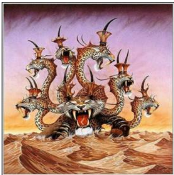
Het beest uit de zee met tien horens en zeven koppen.

Men wil zich ontdoen van hen die zich tegen de komende New Age Wereld Orde zullen verzetten. Volgens de demonische geesten is dit noodzakelijk, om een nieuwe hemel en een nieuwe aarde vol vreugde tot stand te brengen. De New Age wereldreligie voldoet aan alle criteria van de valse kerk die in de laatste dagen zal optreden. De New Agers beweren dat de mensheid aan de drempel staat van een Nieuwe Orde, het grote ontwaken. Openbaring 17 laat zien dat er een satanisch religieus systeem zal heersen over alle rassen, volken, stammen en talen, en vol zal zijn van gruwelen en onreine dingen. Het zal een herleving zijn van de mysteriereligie van het oude Babylon, voordat de taal door God werd verward.