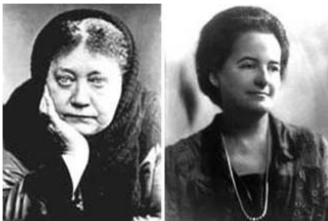
Links Helena Blavatsky, rechts Alice Baily.

toebedeeld en genieten een zekere 'bescherming' van hun 'Meesters' (demonen). Tot de meest bekende woordvoerders van de 'Meesters' behoren de eerder genoemde Alice Baily en Helena Blavatsky.