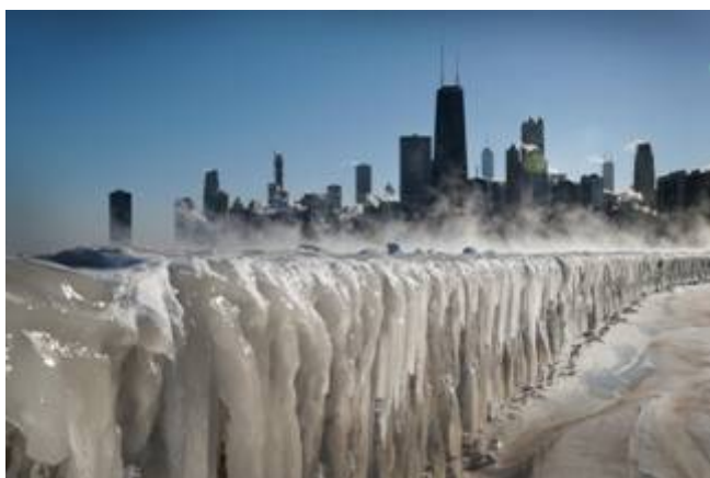
Chicago in de winter van 2019

Ook in de voorgaande jaren was het iedere winter raak. Zo was begin januari 2010 56% van de Verenigde Staten bedekt met sneeuw, iets wat al tientallen jaren lang niet meer was voorgekomen.