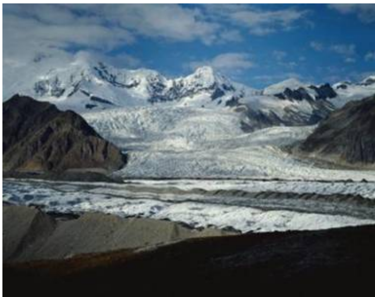
Gletsjer in de Himalaya

ontwikkeling van gletsjers in het Himalaya gebergte en ontdekte dat de afkalving reeds in 2007 tot stilstand is gekomen.