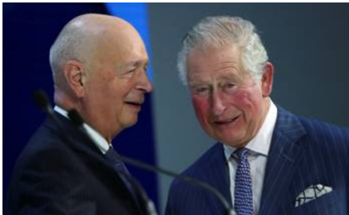
Twee griezels van de WEF-sekte samenzwering

voor grote verandering zou bestaan. Hij sprak van een “globaal Marshall-plan” en prees in dit verband de “handelingsoproepen in het kader van de Great Reset”. Het zou dit “ene moment zijn waarin we zo veel mogelijk vooruitgang als mogelijk zouden moeten boeken”. Kort daarvoor was hij zelfs mede gastheer bij een online WEF-top, die de “Great Reset” moest voorbereiden.