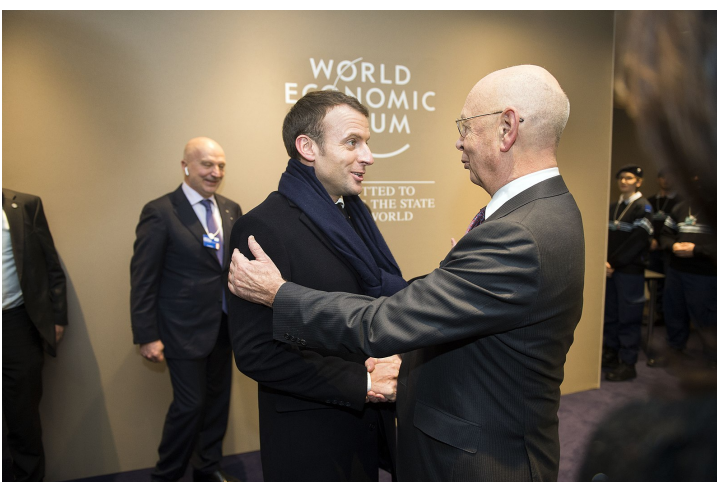
Klaus Schwab en zijn puppet Macron

Onder de eerste groep van het WEF-sekte behoren o.a. de voormalige Duitse Bondskanselier Angela Merkel en de Britse premier Tony Blair , voormalig Labour-premier Gordon Brown (WEF 1993) en de Franse president Macron. Deze figuren hadden toen nog geen politieke carrière gemaakt.