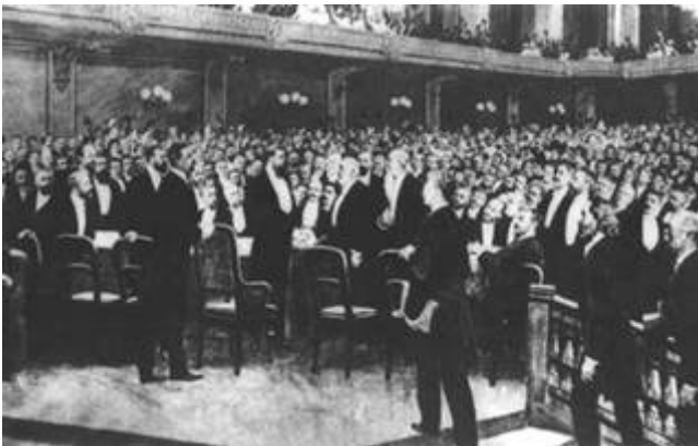
Het Eerste Zionisten Congres in Bazel, Zwitserland.