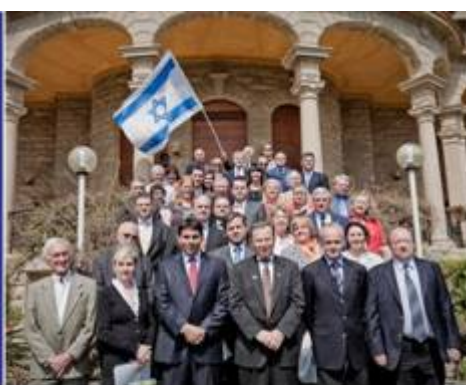
Villa Devachan April 25, 2010