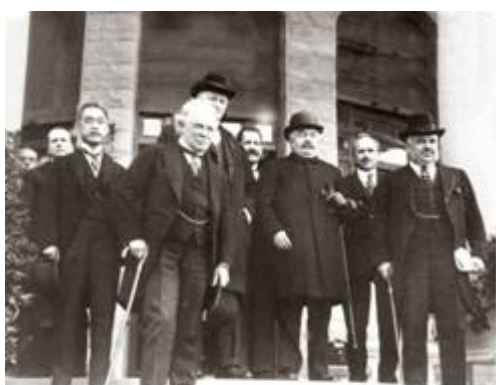
Villa Devachan April 25, 1920

In april 1920 gaf de pas gevormde Volkenbond Groot-Brittannië het mandaat over 'Palestina' en werd dit land met de uitvoering ervan belast. Tijdens de San Remo conferentie gehouden van 19 tot 26 april 1920 door de eerste-ministers van Frankrijk (Millerand), Groot Brittannië (Lloyd George) en Italië (Nitti) en Japanse, Griekse en Belgische afgevaardigden, is Israëls recht op het land vastgelegd in een aantal bindende documenten waarin de bewoording uit de Balfour Declaratie zijn overgenomen.