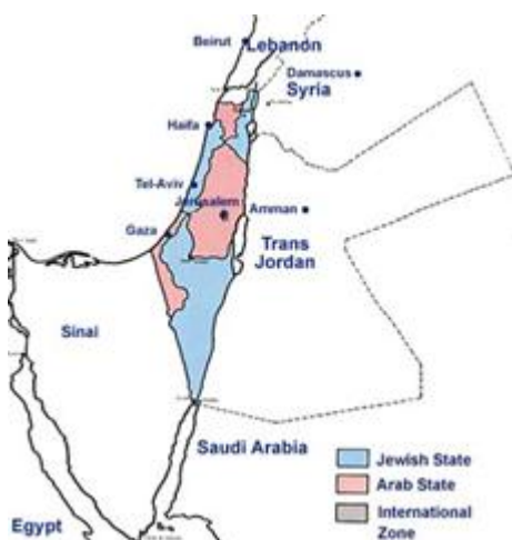
Het resultaat van VN resolutie 181

De volkomen illegale beslissing van de Verenigde Naties, leverde de Arabieren in totaal (inclusief Jordanië dus) maar liefst 82.7 procent land op dat aanvankelijk door de Volkerenbond aan de Joodse staat was toegewezen, en hielden de Joden daar maar 17.3 procent van over wat ook nog eens voor 65 procent bestond uit woestijn.