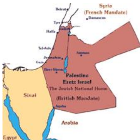
Het aan Israël toebedeelde grondgebied

Ook de 52 regeringen van de landen van toenmalige Volkenbond (waarvan 25 Europese landen) erkenden tijdens een bijeenkomst op 24 juli 1922 unaniem, het Britse mandaat en de rechtmatigheid van de in de Balfour-declaratie uitgedrukte beginselen waaronder de grenzen van het aan het Joodse volk toebedeelde grondgebied . Internationale juridische experts leggen in deze video uit waarom de Joodse staat internationale legitimiteit geniet, en het wettelijke recht heeft om Judea, Samaria en Gaza te besturen. Zij leggen uit waarom, in tegenstelling tot wat velen beweren, het bestaan van Israël wettig is en door de Verenigde Naties wordt gesteund. In weerwil van artikel 5 van het mandaat, cedeert Groot-Brittannië de Golanhoogvlakte aan het Franse mandaatgebied Syrië. Daarmee wordt volkomen illegaal dat gebied voor Joodse vestiging gesloten.