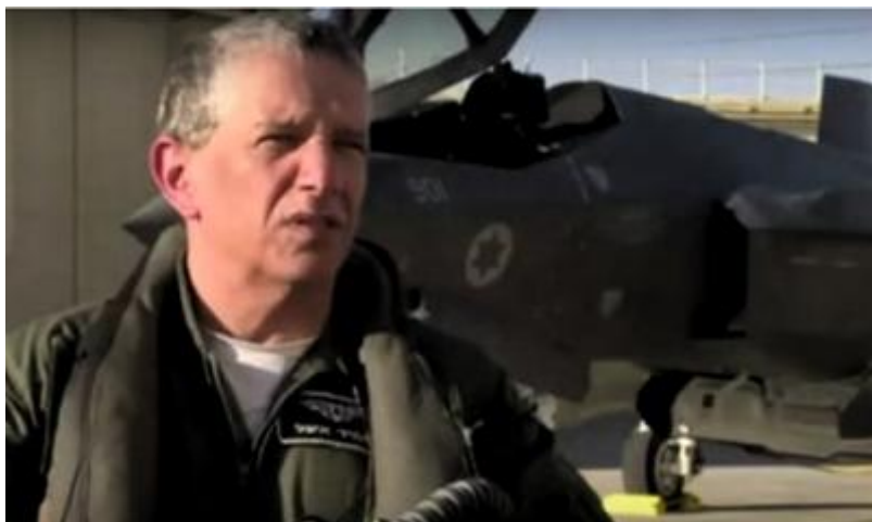
IAF Commander Major-General Amir Eshel

Op 21 juni 2017 waarschuwde Amir Eshel het hoofd van de Israëlische luchtmacht dat het "ondenkbare" militaire macht ter beschikking heeft in een toekomstig conflict met Hezbollah. "Waar de luchtmacht tijdens de vorige Libanon-oorlog in 2006, 34 dagen nodig had om de weerstand van Libanon-Hezbollah te breken, kunnen wij dat vandaag in 48-60 uur doen. Wij beschikken over een onvoorstelbare vernietigingskracht, totaal verschillend van wat de wereld in het verleden te zien heeft gekregen. De mensen hebben geen idee van wat ze te zien zullen krijgen."