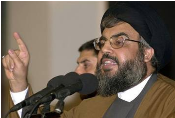
Hezbollah terreurleider Hassan Nasrallah

Israëlische slachtoffers te betreuen zullen zijn. Hij wees daarbij op de enorme ammoniak-opslagtank in Haifa en de kernreactor in Dimona.