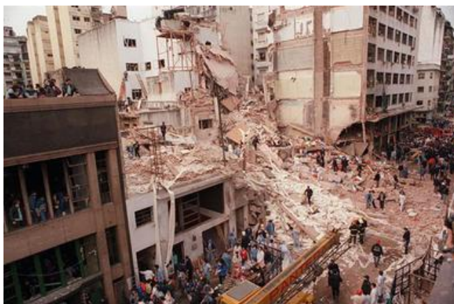
Ravage na aanslag in Buenos Aires in 1994.

Hezbollah is verantwoordelijk voor een hele serie terreuraanslagen en ontvoeringen van Westerlingen in Libanon, inclusief Amerikanen in de tachtiger jaren. met inbegrip van de zelfmoordbomaanslag van april 1983 toen een vrachtwagen geladen met explosieven inreed op de Amerikaanse ambassade in Beiroet. Hierbij kwamen 241 mariniers om het leven. Tot de meest bekende aanslagen behoren ook de aanslag op de Israëlische ambassade in Buenos Aires van 17 maart 1992 waarbij 29 doden vielen en 242 gewonden. Ook de aanslag op een Joods cultureel centrum in Buenos Aires gekend als de AMIA bombing op 18 juli 1994 waarbij 85 mensen werden gedood en honderden gewond, werd gepleegd door Hezbollah.