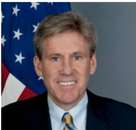
De vermoorde Christopher Stevens

Op 18 september 2012 schreef de Israëliische krant Arutz-7 dat de moord op Stevens geen spontane volkswroede was maar een geplande aanslag. Een voormalige piloot die voor de CIA werkte onthult dat Stevens werd vermoord om te voorkomen dat de rechtstreekse wapenleveranties van de VS aan de terreurbeweging Al-Qaeda aan het daglicht zouden komen. Ambassadeur Stevens zou geklaagd hebben over de aan islamitische jihadististen verstuurd Amerikaanse wapens, inclusief Stinger-luchtafweerraketten. Deze gang van zaken wijst erop dat Stevens werd vermoord nadat hij het ministerie had laten weten dat hij tegen de levering van hittezoekende raketten en andere wapens aan Al-Qaeda was.