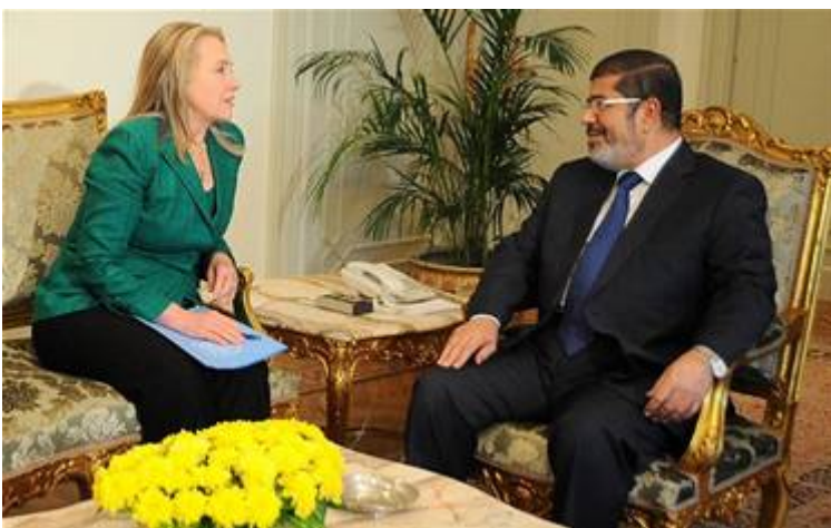
Hillary Clinton bij de Moslimbroederschap extremist Mohammed Mursi

Op 14 juli 2012 was Hillary Clinton in opdracht van Obama in Egypte om haar openlijke steun uit te spreken voor antisemitische racistische moslimbroederschapsextremist Mohammed Mursi, de 'winnaar' van de verkiezingen in Egypte op 30 juni 2012.