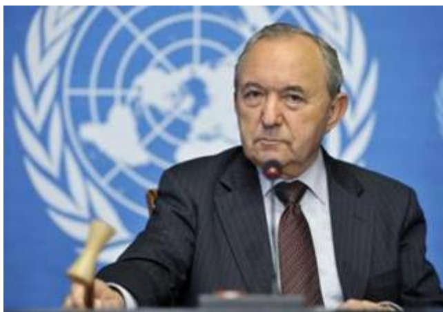
De Zuid-Afrikaanse rechter Richard Goldstone

De volgende aanval kwam van Human Rights Watch , de bekende spreekbuis van anti-Israël activisten. Ook deze club beschuldigde Israël van wandaden en ook van het gebruik van witte fosfor in dicht bevolkte gebieden in Gaza. Maar het Rode kruis heeft deze beschuldiging tegengesproken en verklaarde dat er geen bewijs bestaat dat witte fosfor door Israël in strijd met het internationaal recht werd gebruikt. Hoewel Human Rights Watch nog steeds een bepaalde status geniet, heeft deze club haar “morele kompas” al lang geleden verloren. Alsof de wereldopinie met deze rapporten nog niet genoeg op allerlei perverse leugens is getrakteerd, verscheen op 15 september 2009 het 575 pagina’s tellende “ Goldstone rapport ” genoemd naar de Zuid-Afrikaanse rechter en voormalig internationaal aanklager voor oorlogsmisdaden Richard Goldstone, een man van Joodse afkomst.