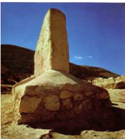
Altaar op de berg Ebal.

De structuur van het altaar is dezelfde als alle later in de Bijbel en op andere plaatsen beschreven altaren van het Joodse volk.