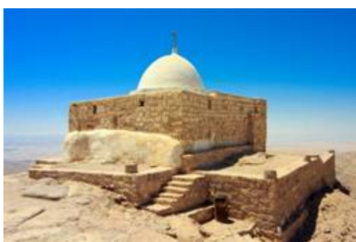
Jabal Haroun, de berg van Aäron

het land, dat Ik de Israëlieten geef, Neem Aäron en zijn zoon Eleazar en laat hen de berg Hor beklimmen; laat Aäron zijn klederen uittrekken en bekleed zijn zoon Eleazar daarmee, dan zal Aäron tot zijn voorgeslacht vergaderd worden en daar sterven. Toen stierf Aäron daar op de top van de berg.”