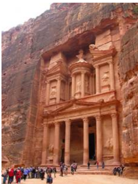
Petra in Jordanië

De koning van Edom weigerde hem echter de doortocht waardoor Mozes zich genoodzaakt zag een andere route te nemen. De genoemde koninklijke weg verbond sedert onheuglijke tijden Damascus met West Arabië. De route die Mozes volgde liep langs een gebied met grillige bergen. Midden in dit bijna onherbergzame gebied ligt in een vallei de oude stad Petra, bereikbaar via een nauwe kronkelende kloof die de naam "El Sik" draagt.