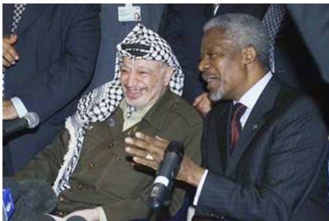
Jasser Arafat –Kofi Annan, vrienden onder elkaar.

terreurbewind in Ramallah of Hamas is Gaza. Een van de vier doelstellingen van de VN luidt 'de bevordering van de internationale vrede en veiligheid' maar dat was bij Annan niet op Israël van toepassing.