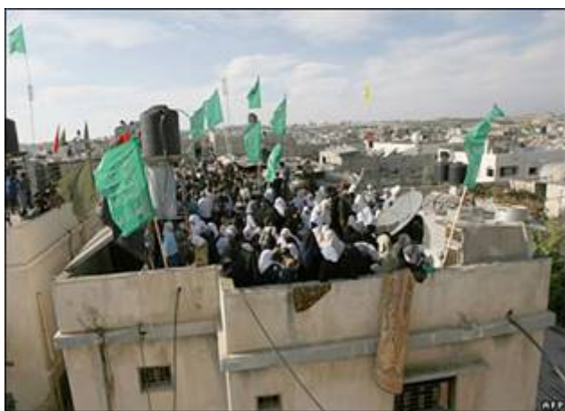
Menselijke schilden door Hamas op daken neergezet van gebouwen die dienden als wapenopslagplaatsen en daarom mogelijk door Israël gebombardeerd zouden worden.

De leugenmachine van de UNRWA sprak over meer dan 1800 gedode Arabieren, voornamelijk burgers. De internationale media nam de nazipropaganda over zonder ook maar enige controle uit te oefenen. Volgens een door Israël gedaan onderzoek zijn er gedurende de oorlog Cast Lead in 2008-2009, 1166 mensen omgekomen. 709 daarvan zijn geïdentificeerd als terroristen van Hamas en van andere terreurorganisaties. Volgens diezelfde gegevens werden 295 ‘burgers’ gedood waarvan 89 onder de leeftijd van 16 jaar waarvan sommigen stierven met een raketlauncher in hun handen. Verder zijn er 49 vrouwen omgekomen waarvan een onbekend aantal door Hamas als menselijk schild zijn gebruikt. Ze gaven dat ook openlijk toe.