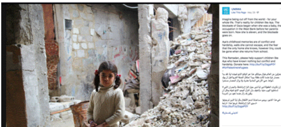
De originele foto uit Qabr Essit nabij Damascus in Syrië.