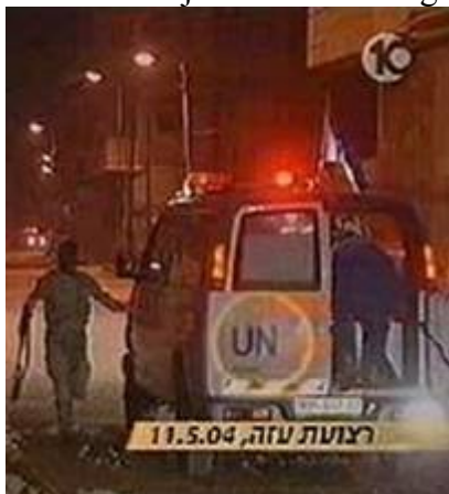
VN-ambulance gebruikt door PLO-terroristen

In de zomer van 2002 arresteerde het Israëlische leger Nidal Nazal, een UNRWA-ambulance chauffeur en deze vertelde dat zijn ambulance is gebruikt voor het transport van munitie en het overbrengen van berichten tussen verschillende terreurbewegingen. Andere gearresteerde terroristen verklaarden dat wagens van de UNRWA werden gebruikt voor het vervoer van terroristen naar de plaatsen van aanslagen.