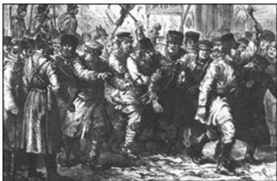
Pogroms in Rusland

Het smaadschrift heeft in de ruim 100 jaar van zijn bestaan miljoenen mensen ertoe aangezet, hun Joodse medemens onnoemelijk leed te bezorgen. De sterk antisemitische Tsaar Nicolaas II zag in de Protocollen een mogelijkheid om 'de Joden' te beschuldigen van steun aan de ophanden zijnde revolutie. Hij liet het boekje in grote oplage verspreiden, met als resultaat bloedige pogroms.