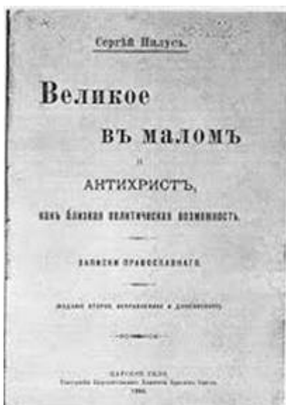
Protocollen van de wijzen van Sion. Omslag van de eerste druk

Hoewel het bij deze “Protocollen” gaat om een fictief verslag van een vergadering van joodse leiders , dat in 1897 zou hebben plaatsgevonden in Bazel duikt dit schandelijke antisemitische smaadschrift steeds opnieuw op in de Arabische wereld en op allerlei antisemitische en Israël hatende sites. Al direct na de verschijning is duidelijk geworden dat het bij het geschrift om een vervalsing ging. Het gaat om het meest smerige antisemitische geschrift aller tijden. Het verhaal gaat dat joodse leiders (wijzen van Sion) bijeen zouden zijn gekomen om de christelijke maatschappij omver te werpen. Ook zouden zij plannen hebben gesmeed voor een joodse wereldheerschappij; de “Protocollen” beschrijven tot in detail hoe deze verwezenlijkt zou moeten worden. Het geschrift werd en wordt daarom volop geciteerd door antisemieten om er het “joodse gevaar” mee aan te tonen. Omdat de vrijmetselarij ook genoemd wordt in de Protocollen, is dit voor sommigen een bewijs dat er een Joodsmaçonnieke samenzwering bestaat.