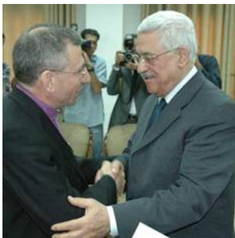
Munib Younan met PLO-baas Abu Mazen (Mahmoud Abbas). Twee handen op één buik!

De christelijke leiders in Israël geloven niet alleen dat God's verbond met Israël niet meer van toepassing is, maar noemen ook het geloof in een letterlijke eindtijd zelfs 'ketterij'. Munib Younan van de Evangelische Lutherse Kerk in Jeruzalem vindt dat de Luthersers 'alle christenen moeten waarschuwen tegen de valse leer, dat de grote wereldrampen, oorlogen en plagen genoemd in het Bijbelboek Openbaring letterlijk zullen gebeuren.'