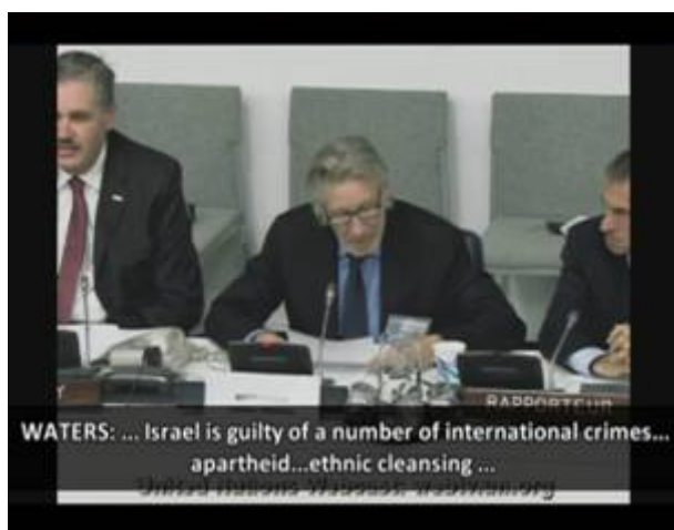
Waters tijdens zijn toespraak

Tijdens een optreden in België choqueeerde hij een deel van het publiek met antisemitische uitspraken. Onder het concertthema 'dictatoriale regimes' liet Waters een opblaasvarken op daarop een davidster geprojecteerd. Geschokte muzikliefhebbers merkten op dat er ook een tijdlang een silhouet van een man geprojecteerd werd die de nazigroet brengt. Waters zong ondertussen het lied 'In the Flesh' waarin hij Joden uitmaakt voor uitschot. Waters droeg zelf een dictatoroutfit die verdacht veel leek op een naziuniform en schoot aan het eind van het liedje het varken met een replica machinegeweer aan flarden.