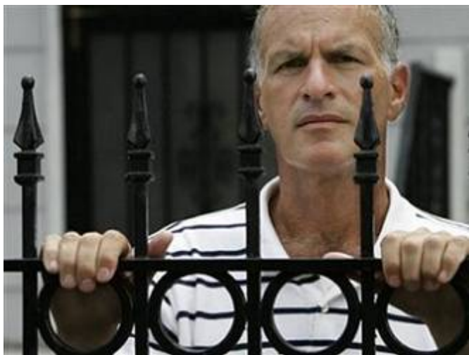
Anti-Israël activist Norman Finkelstein

(*)Zelfs gerespecteerde wetenschappers als Noam Chomsky en Norman Finkelstein; beide Amerikanen worden in Israël beschouwd als antisemitische Joden. Prof. Dr.Finkelstein is de zoon van een Holocaustoverlevende, en als politicoloog verbonden aan de DePaul-university in Chicago. Hij zei over Israëls militaire actie 'Gegoten Lood' in 2009 als antwoord op duizenden raketten van Hamas: 'Israël begaat in Gaza een Holocaust.' Een Holocaust is het op systematische wijze uitroeien van een etnische groep. In de geschiedenis van de mensheid waren het steeds weer de Joden, die men wilde uitroeien. En dat alleen op basis van het feit dat ze bestonden. Het is overbodig te zeggen dat het gelijkstellen van Israëlische soldaten aan Nazi's niet alleen absolute onzin is, maar ook puur antisemitisme.