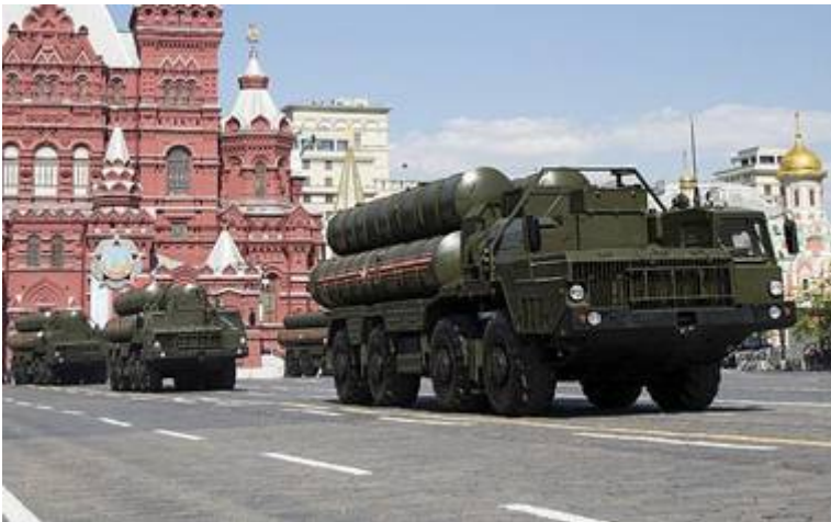
Russische S-300 luchtafweerraketten tijdens militaire parade op 9 mei 2016

Rusland heeft lange tijd toegestaan dat Israël luchtaanvallen uitvoert op Iraanse en Hezbollah-strijdkrachten in Syrië, maar heeft te kennen gegeven dat Israël daar mee moet stoppen en waarschuwt voor een “scherpe escalatie”. Israël weigert hier echter gehoor aan te geven want de opbouw van Iraanse troepen in Syrië wordt als een directe bedreiging voor de Joodse staat beschouwd. Normaal bestookt Syrië de Israëlische aanvallen met tientallen luchtafweerraketten, maar dat heeft tot dusver weinig resultaat opgeleverd. Terwijl de Israëlische luchtmacht recent verschillende doelen bombardeerde in de buurt van de stad Masyaf in het noordwesten van Syrië, waren het dit keer Russische strijdkrachten die met geavanceerde S-300 luchtafweerraketten het vuur openen op Israëlische gevechtsvliegtuigen, schrijft The Times of Israel. De vliegtuigen keerden echter allemaal veilig terug op hun basis en waren nooit echt in gevaar. Toch betekent dit een belangrijke en gevaarlijke beleidsverandering van de kant van Moskou.