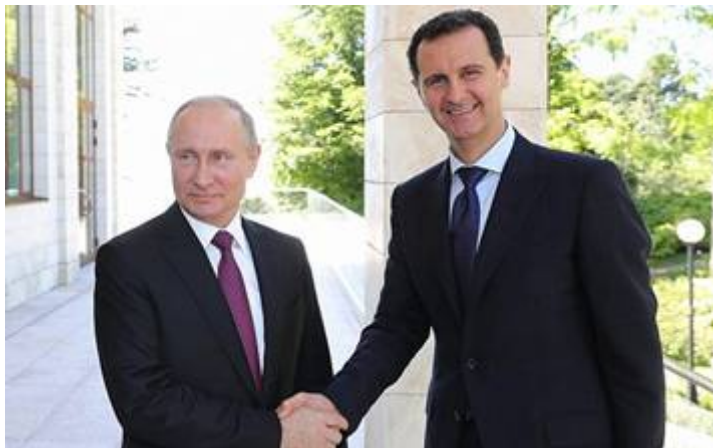
Poetin en de Syrische dictator Assad

kant van de Golanhoogten . Velen vrezen dat dit uiteindelijk zou kunnen uitmonden in een gewapende confrontatie. Een aankondiging van het Russische ministerie van Defensie op 28 februari 2022 met betrekking tot gezamenlijke Russische en Syrische luchtmachtpatrouillemissies langs de Golanhoogten, vertegenwoordigt een belangrijke boodschap van Moskou over zijn bedoelingen, aldus Israëliische waarnemers. Het lijkt er op dat Poetin zijn blik ook op het Heilige Land heeft gericht. Dat is wellicht de reden waarom hij de Syrische dictator Bashar al- Assad van de ondergang heeft gered , terwijl Washington druk doende was met hulp van ISIS hem van het toneel te verwijderen. Dat is niet gelukt. Poetin blijft al-Assad, onverminderd steunen en ook is hij heel close met de Libanese terreurbeweging Hezbollah en de middeleeuwse Ayatollahs in Iran. Poetin steunt zo ongeveer alle vijanden van Israël op diplomatiek, financieel en militair gebied.