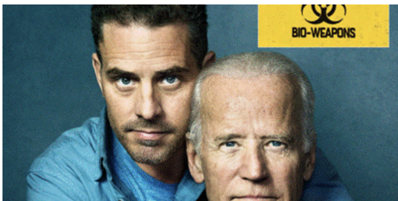
Hunter en Pa Biden.

Er is inmiddels heel wat deining ontstaan over de Amerikaanse biolabs in de Oekraïne. Westerse leiders en media buitelden over elkaar heen om de bewering van de Russen dat Hunter Biden , de zoon van de Amerikaanse president heeft geholpen bij het financieren van een Amerikaans militair onderzoeksprogramma naar biowapens in Oekraïne, naar het rijk der fabelen te verwijzen. De Britse Daily Mail , die inzage heeft gekregen in mails op de laptop van Hunter Biden, bericht dat hij miljoenen heeft ingezameld voor een Amerikaanse aannemer in Oekraïne die gespecialiseerd is in het onderzoek naar dodelijke ziekteverwekkers. Bij dat programma zou ook miljardair George Soros betrokken zijn. Waar is deze megacrimineel niet bij betrokken? De beschuldigingen werden in eerste instantie afgedaan als Russische propaganda, maar de e-mails waar de Daily Mail de hand op heeft weten te leggen, laten zien dat de beweringen kloppen.