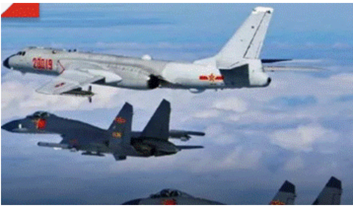
Een Y-8 Chinees verkenningsvliegtuig geflankeerd door gevechtsvliegtuigen

Taiwan wordt als een afvallige provincie van China beschouwd en de Chinese leiders vinden dat Taiwan weer onder Chinees beheer terug moet keren en is bereid om daar alle middelen voor in te zetten. Dat China Taiwan ziet als een onlosmakelijk onderdeel van het Chinese vaste land wordt echter niet door geschiedenis bevestigd. Taiwan viel tijdens WO II al sinds 1895 onder de jurisdictie van Japan , lang voordat Chiang Kai-