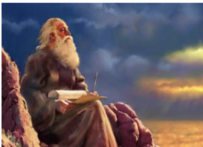
Johannes op Patmos

Het boek Openbaring maakt duidelijk dat Johannes aanwezig mag zijn bij het hemelse openingsceremonieel van het Boek met Zeven Zegels, waarin Gods grote eindafrekening met onze wereld is beschreven. God zal handelend gaan optreden. Johannes ziet wat er vanuit Gods perspectief staat te gebeuren.