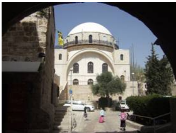
De gerestaureerde Hurva synagoge in Jeruzalem

Hurva synagoge, door de Jordaanse troepen verwoest. Deze synagoge is op 15 maart 2010 voor de derde keer plechtig ingewijd. Het gebouw is altijd het centrum van de Joodse gemeente geweest.