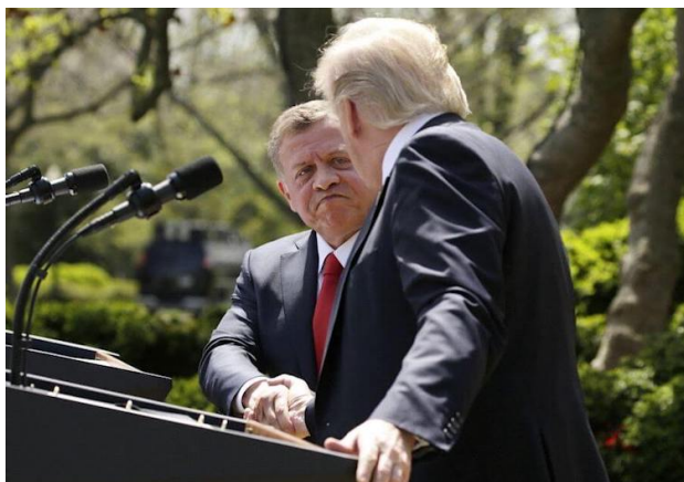
Hier begroet Trump de Jordaanse koning Abdullah II tijdens een gezamenlijke nieuwsconferentie in het Witte Huis