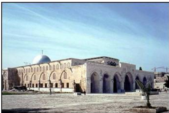
De Al Aksa moskee. Van oorsprong een Byzantijnse kerk

De waarheid is dat ten tijde van Mohammed- die in 632 n.Chr., stierf- Jeruzalem een christelijke stad was in het Byzantijnse rijk. Jeruzalem werd pas in 638 door Kalief Omar veroverd . In die tijd stonden er alleen kerkgebouwen in de stad en ook op de Tempelberg. Omstreeks het jaar 711, 79 jaar na de dood van Mohammed werd de Byzantijnse kerk op het Tempelplein in een moskee veranderd. Na wat kleine verbouwingen noemde men de kerk voortaan de Al-Aksa moskee en werd het Tempelplein omgedoopt in Haram-esh Sjarief. Mohammed kon dus nooit deze moskee in gedachten hebben gehad, toen hij de Koran schreef, want hij was toen al lang dood. De naam Haram-esh Sjarief heeft dus helemaal niets met de Tempelberg in Jeruzalem te maken maar met de moskee in Medina in Saoedi-Arabië.