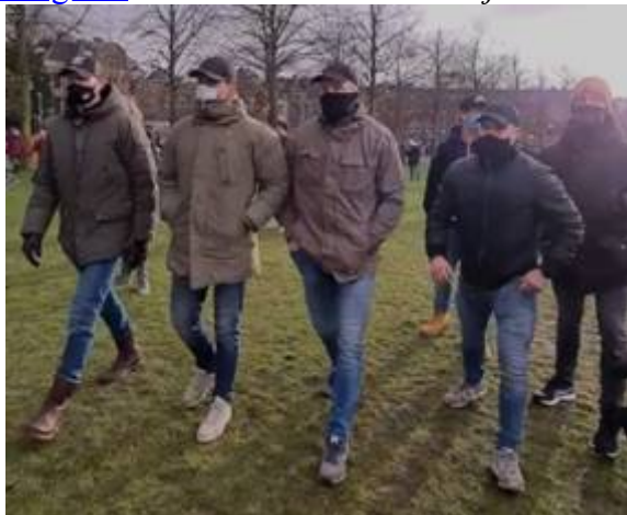
Romeo's actief op het Malieveld op 14 maart 2021.

Sommigen vertellen dat zij bijvoorbeeld de opdracht te krijgen om voor kleine vergrijpen zoals het niet dragen van een mondkapje, buitenproportioneel zware methodes in te zetten: “Op een bepaald moment ga je geestelijk en mentaal een grens over, kom je in een spiraal terecht waarin je elke terughoudendheid laat varen. Geweld toepassen tegen demonstranten is standaard geworden. We moeten er met volle kracht in. Voorheen sloegen ME'ers op de benen, maar nu krijgen ze de opdracht om op het hoofd te slaan. Een bebloed hoofd schrikt af, zeggen ze.” Een van de agenten vertelde dat hij op 21 juni 2020 moest optreden bij de verboden demonstratie op het Malieveld . Zijn eenheid blokkeerde het station. “Wij moesten voorkomen dat ‘het tuig’ ongehinderd de trein kon pakken naar een ‘verboden wappiedemonstratie’.” Later noemde Rutte de betogers ‘doorgesnoven hooligans’ . “Onvoorstelbaar dat hij het uit zijn mond kreeg. Alle verklaringen die door de overheid over dit geweld naar buiten zijn gebracht, zijn gelogen.” aldus de agent.