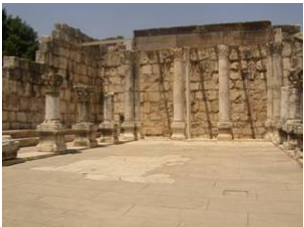
De synagoge in Kapernaüm

In 132 na Christus kwam het Joodse volk onder leiding van Simon Bar Kochba (Kosiba) opnieuw in opstand tegen de Romeinse overheersers. De aanleiding van deze opstand was dat keizer Hadrianus in allerlei wetten tegen het Joodse geloof uitvaardigde en tevens besloot op de ruïnes van het verwoeste Jeruzalem een nieuwe stad te bouwen met een heidense tempel op de plaats van de verwoeste Joodse Tempel. Bar Kochba zag zich kans Jeruzalem te veroveren en drie jaar stand te houden tegen de Romeinse overmacht. Maar uiteindelijk brak de Joodse tegenstand toen 50.000 Romeinse soldaten Bar Kochba in de vesting Bethar omsingelden wat een bloedig einde maakte aan de opstand. Bar Kochba sneuvelde met duizenden van zijn volgelingen. Talloze anderen werden gedeporteerd of als slaven verkocht. Ook vanaf die tijd zijn er altijd groepen Joden in Galilea en andere delen van het land blijven wonen. Bewijzen daarvoor zijn onder meer te vinden in Kapernaüm, waar de resten te zien zijn van een synagoge uit de vierde eeuw n.Chr. Deze synagoge was gebouwd op de fundamenten van de synagoge uit het begin van de jaartelling.