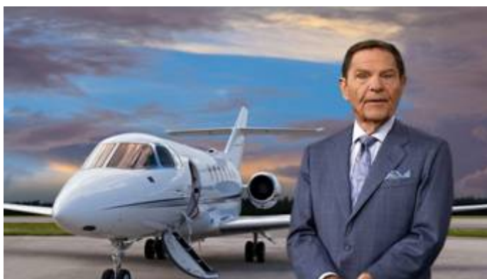
Kenneth Copeland hier bij één van zijn privévliegtuigen.

Wat er in Todd Bentley's bijeenkomsten gebeurd is een schande voor het christendom. Hier wordt de mens openlijk als een idioot te kijk gezet en verleid door dwalingen die niets met de ware Heilige Geest van doen hebben. Maar desondanks is hij nog steeds een zeer gewilde spreker in vele kerken en gemeenten overal ter wereld en laten velen zich door deze clown verleiden. Diverse Tv-evangelisten zorgen ervoor dat de gezonde Bijbelse leer steeds meer wordt losgelaten en uitgehold. Een van de 'profeten' die ook het welvaartsevangelie in zijn meest banale vorm laat zien is Kenneth Copeland .