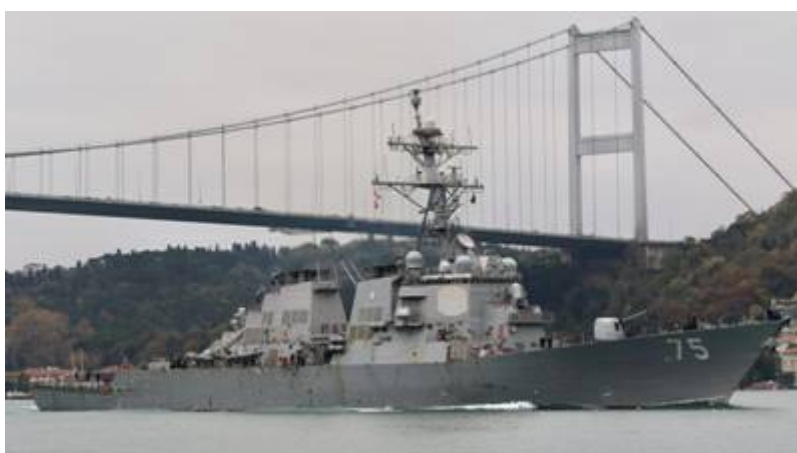
Amerikaans oorlogsschip in de Bosporus op weg naar de Zwarte

Inmiddels zijn een tweetal Amerikaanse oorlogsschepen via de Bosporus in de Zwarte Zee aangekomen voor de zuidkust van Rusland in een beweging die algemeen wordt gezien als een blijk van steun voor de Oekraïne. Het gaat om de USS Roosevelt een torpedobootjager uit de Arleigh Burke-klasse, en de USS Donald Cook, een geleide raketvernietiger. Na de Amerikaanse marineoefeningen in de Zwarte Zee in februari 2021 waarschuwde het Kremlin de Amerikaanse marineschepen in de Zwarte Zee te zullen vernietigen indien ze worden ingezet bij een eventuele militaire aanval van de Oekraïne op onder meer De Krim en dat dit tot een ramp zouden kunnen leiden. Rusland noemt de aanwezigheid van de Amerikaanse oorlogsschepen een ernstige provocatie en is als reactie daarop begonnen met oefeningen in de Zwarte Zee .