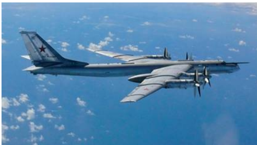
Russische nucleaire bommenwerper, bewapend met zes nucleaire kruisraketten.

De Verenigde Staten en Europa krijgen ook regelmatig bezoek van Russische bommenwerpers van het type Tu-95 Bear elk bewapend met zes nucleaire kruisraketten die vanaf grote afstand kunnen worden afgevuurd. Volgens een Russische militaire woordvoerder maken dit soort acties deel uit van ‘simulatieaanvallen op de vijand’.