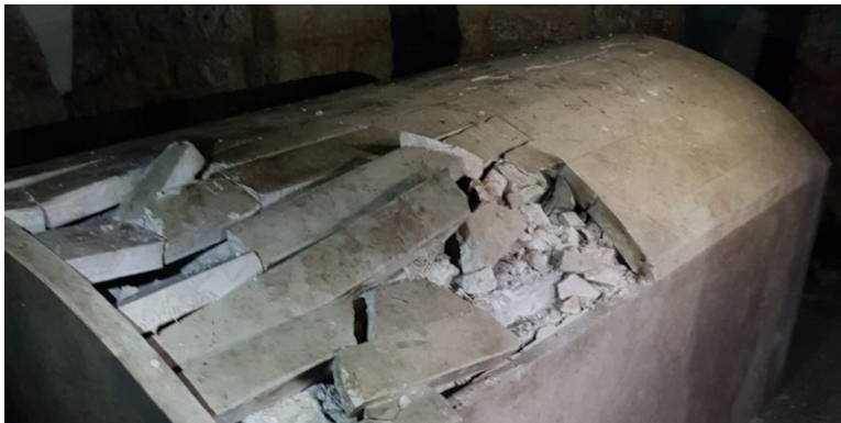
Schade aan het graf van Jozef veroorzaakt door Arabische reischoppers, 10 apr. 2022. (Twitter/Screen grab)

Ook de grafsteen die het graf van Jozef markeerde werd vernield. De schade is enorm en niet alleen aan de eigendommen van het Joodse volk, maar ook een schade aan een historische plek die duizenden jaren oud is. Twee chassidische joden werden op 11 april neergeschoten en gewond toen ze probeerden het graf te bezoeken. In de Oslo Akkoorden van 1994 werd het graf aanwezen als een plaats onder Israëlische controle. Wijdverspreide Arabische rellen en internationale druk leidden ertoe dat Israël in het begin van 2000 het beheer van de site overgaf aan de Palestijnse Autoriteit. Sindsdien zijn er meerdere brandstichtingen geweest en herhaalde incidenten van Arabische menigten die Joden aanvielen die de plaats bezochten om er te bidden.