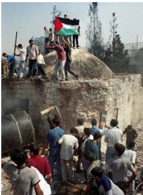
PLO-Arabieren verwoestten het graf van Jozef in het Bijbelse Sichem in september 2000.

Volgelingen van Arafat lieten hier de gewonde Israëlische soldaat Madhat Yusuf doodbloeden door ambulancepersoneel de toegang te beletten. In een poging de gemoederen te kalmeren besloot de toenmalige Israëlische premier Ehud Barak daarop het leger bij de tombe terug te trekken. Honderden uitzinnige barbaren, waaronder politieagenten, trokken vervolgens naar het graf, beukten met mokers de muren kapot en staken de bijbehorende synagoge in brand. Tweeduizend heilige boeken werden verbrand en meer dan drieduizend jaar Joodse geschiedenis totaal verwoest. Wat niet onder de slopershamer viel werd gestolen: computers, aanrechten, en zelfs toiletpotten. Rabbiijn Hillil Lieberman die een kijkje kwam nemen omdat hij niet kon geloven wat er gebeurt was, werd op gruwelijke wijze vermoord.