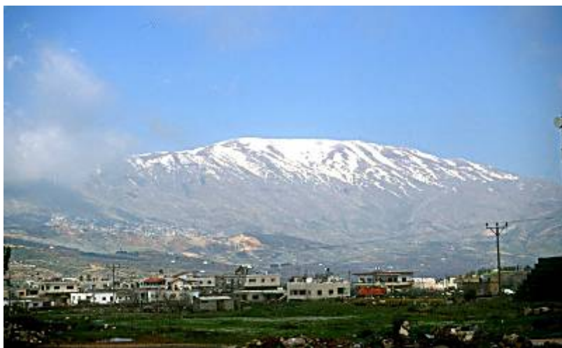
De berg Hermon

Daar het koninkrijk Gods bij Jezus begon, was de tijd waartoe God besloten had vervuld. Voor de mensheid was dit het beslissende uur, dat vroeg om een bekering in gedachte en intentie, en geloof in Jezus. Zijn prediking vond plaats rondom het met zoet water gevulde Meer van Galilea, ook wel Zee van Tiberias, Meer van Kinneret en andere namen aangeduid. Het meer ligt 212 meter beneden de zeespiegel. In de verte verheft zich de berg Hermon.