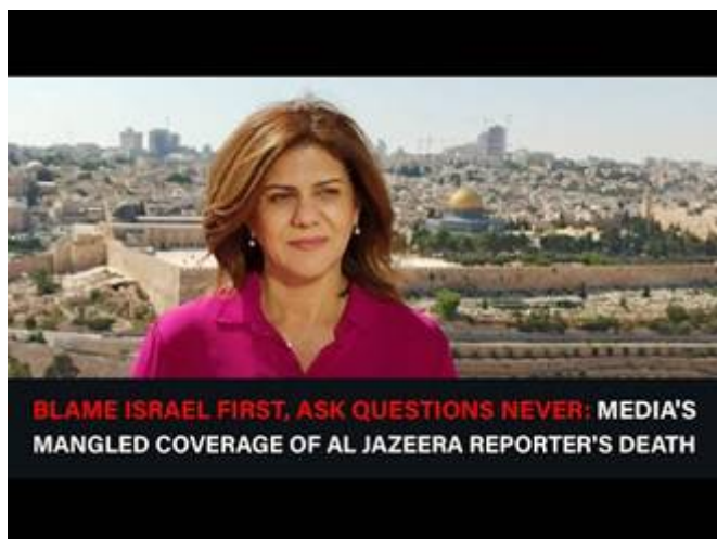
Al-Jazeera senior reporter Shireen Abu Akleh

en propagandadoeleinden tegen de Joodse staat. Men spreekt van een bewuste door Israëlische militairen gepleegde “executie”.