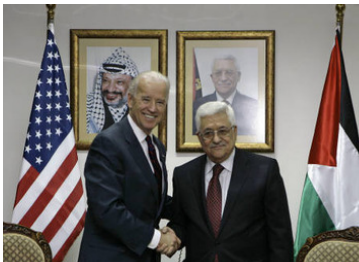
Biden op bezoek bij terreurbaas Mahmoud Abbas in Ramallah.

Het besluit laat zien dat het de Biden-administratie niet kan schelen dat de PLO-bende doorgaat met het verheerlijken en omarmen van terroristen die Joden en anderen vermoorden en verwonden.