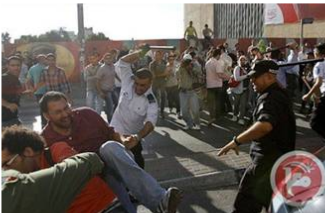
Grof geweld door PA-politie

Bij vreedzame demonstraties wordt dikwijls gebruik gemaakt van knuppels en geweerkolven en wordt de uitrusting van journalisten vernield. Er zijn gevallen bekend dat de armen van demonstranten op hun rug worden vastgebonden, en vervolgens omhoog worden getrokken totdat hun schouders uit de kom zijn. Bovendien vallen politieagenten in burger vrouwelijke demonstranten lastig en komt het tot seksuele overvallen. Hoe gewelddadig het er toe gaat mag ook blijken uit de manier waarop Abbas’ ‘politiekorps’ burgers in elkaar slaat , tijdens manifestaties tegen zijn bewind. Zelfs meisjes worden geslagen .