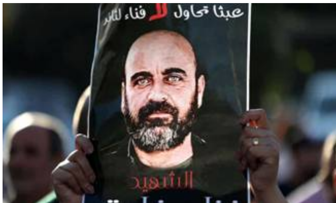
Nizar Banat in zijn cel doodgeslagen

Volgens HRW gebeurt dat op zo'n grote schaal dat er mogelijk sprake is van misdaden tegen de menselijkheid. Mede aanleiding voor het rapport is de dood van Nizar Banat , een van de prominentste critici van de PA. Hij beschuldigde de PA van corruptie. Een jaar geleden werd hij in alle vroegte door tien mannen uit zijn huis gesleurd. Een paar uur later werd hij in zijn cel doodgeslagen. Hij stikte in zijn bloed.