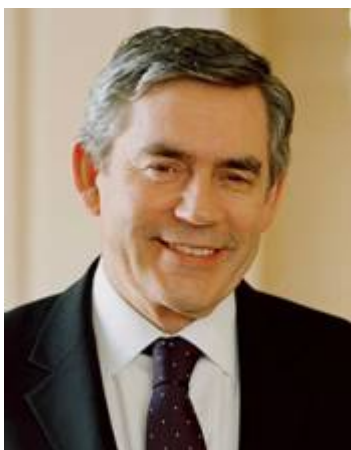
Gordon Brown

De voormalige Britse premier Gordon Brown heeft politieke leiders opgeroepen om een ‘tijdelijke vorm van een wereldregering’ (Nieuwe Wereldorde) op te richten om het Wuhan-virus te bestrijden. Het is niet zo vreemd dat Brown deze uitspraak doet want hij heeft net als een groot aantal andere figuren het ” International Visitors Leadership program ” gevolgd in Amerika bij het “Bureau of Educational and Cultural Affairs” waar ze zijn klaargestoomd om de Elite (globalisten) te dienen . Honderden politieke leiders hebben hier een opleiding genoten waaronder de voormalige Britse premier Tony Blair en de Nederlandse premier Balkenende die de opleiding in 1985 heeft gevolgd gelijktijdig met de voormalige Franse leider Nicolas Sarkozy. Doelstelling van deze opleiding is wereldwijd de reeds bestaande macht van de Globalisten te stabiliseren om op deze manier hun doelstellingen verder te concretiseren, het installeren van een “Nieuwe wereldorde”. Zo ziet Brown het Wuhan-virus kennelijk bij uitstek een middel om dit systeem wereldwijd te installeren omdat het virus inmiddels de hele wereld omvat. Klik hier voor een artikel over 42.000 doden in Wuhan.