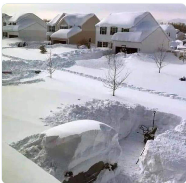
Dit was de situatie op 20 november 2022 in Buffalo

Volgens diverse deskundigen stevend onze wereld juist af op een Global Cooling (kleine ijstijd). Volgens steeds meer astronomen en klimaatdeskundigen kan de aarde door veranderingen op de zon, binnen afzienbare tijd, in een nieuwe (kleine ijstijd) terechtkomen. Als de schijn niet bedriegt lijkt daar inderdaad een begin mee te zijn gemaakt. Waren er vorige winter al signalen van waar te nemen, ook nu worden sommige landen geconfronteerd met hevige sneeuwval en extreem lage temperaturen.