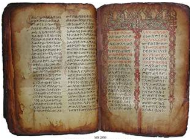
MS 200 Synops. and Catalogue of Books. West, 1497-1508