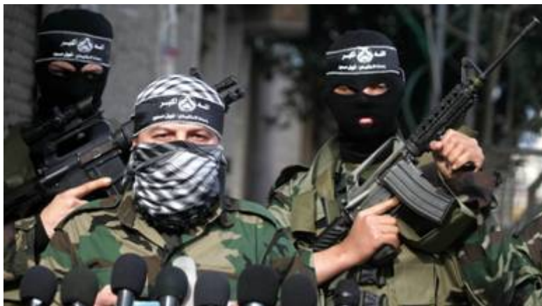
Al Aqsa Martelaren Brigades

Veel Palestijnen zeggen dat de Eerste Intifada (1987-1993), waarbij bijna 200 Israëli's werden vermoord, begon met botsingen in het vluchtelingenkamp Balata in Nablus . Enkele van de meest gruwelijke terreuraanslagen tijdens de Tweede Intifada (2000-2005) werden eveneens uitgevoerd door inwoners van Nablus, waaronder een bomaanslag op een bus in Haifa op 2 december 2001 waarbij 15 Israëli's omkwamen en 40 gewond raakten. De dag na de moordaanslag marcheerden duizenden Hamas-aanhangers door Nablus ter ondersteuning van zelfmoordterrorist Maher Habashi. Vrijwel alle Palestijnse terreurgroepen hebben een basis in Nablus waaronder Hamas , de Palestinian Islamic Jihad (PFLP) en de Al Aqsa Martyrs' Brigades van Fatah.