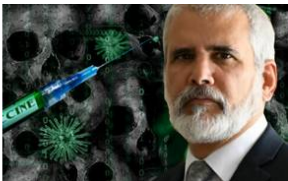
Dr. Robert Malone

Terwijl de EMA meldt dat er 67 kinderen overleden zijn door de experimentele gentherapie , adviseert de Nederlandse Gezondheidsraad om kinderen van 5 tot 11 jaar te laten vaccineren. Volgens Hugo de Jonge staat het belang van de kinderen voorop . Dr. Robert Malone zegt hier waarom 16.000 artsen en medische wetenschappers over de hele wereld een verklaring hebben ondertekend waarin publiekelijk wordt verklaard dat gezonde kinderen niet tegen COVID-19 mogen worden gevaccineerd. Talloze voorbeelden laten zien dat er een plan achter schuil gaat, dat met gezondheid niets te maken heeft. Klik ook hier .