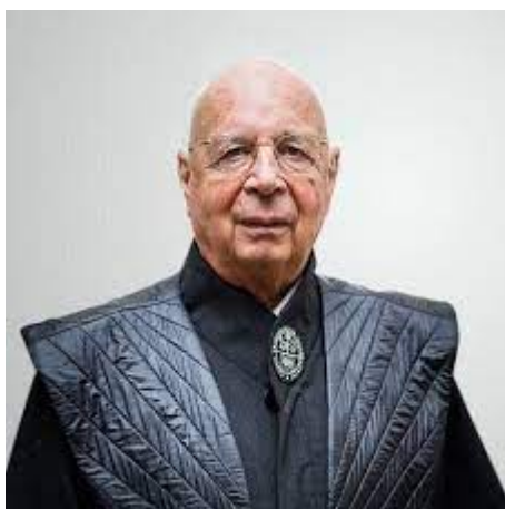
Vrijmetselaar Klaus Schwab

In het Coviv-19 schandaal staat het World Economic Forum , (WEF) centraal. De uit een nazinest van oorlogsprofiteurs afkomstige grote baas van deze club is Klaus Schwab.